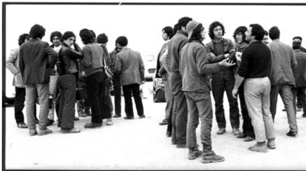
Operai a PORTO TORRES nel 1971

Sorge il sospetto che sia per questo che coloro che negli ultimi processi sono stati raggiunti da questi provvedimenti non sono personaggi riconducibili facil-